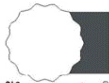
810 * ✓ ① BLANCO DE TITANIO COLOUR OF TITANIUM TITANIUM WHITE TITANUM OXIDE