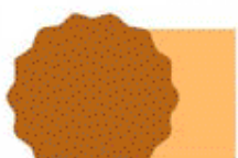
861 * ✓ ① OCRE AMARILLO COBRE DE HIERRO SINTETICO YELLOW OCHRE NATURAL IRON OXIDE