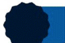
846 * ✓ ① AZUL DE PRUSIA (NIJE) PIGMENTO AZUL PRUSSIAN BLUE (NIJE) COBRE HEXACIANO