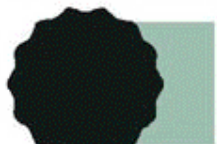
893 ** ✓ ① VERDE VERDIGA VERDE DE COBRE SAP GREEN COBRE VERDE