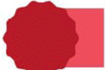
886 ** ✓ ① ROJO MEDIANO PIGMENTO ROJO MEDIUM RED HANBOL RED