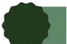
855 * ✓ ② VERDE DE OXIDO DE CROMO COBRE DE OXIDO DE CROMO CHROMIUM OXIDE GREEN CHROMIUM OXIDE