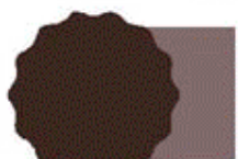
868 * ✓ ① TIERRA SOMBRA TOSTADA COBRE DE HIERRO SINTETICO BURNT UMBER UMBER IRON OXIDE