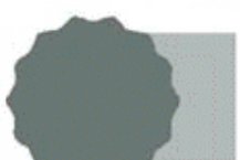
878 * ✓ ③ PLATA COBRE Y MERCURIO SILVER TITANIO DIOXIDO Y MERCURIO