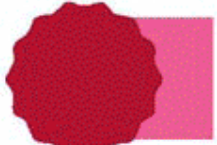
892 * ✓✓ ③ ROJO QUINACRIDONA ROJO QUINACRIDONA QUINACRIDONE RED QUINACRIDONE RED