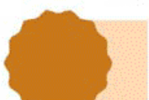
877 * ✓✓ ③ ORO COBRE Y MERCURIO GOLD COBRE Y MERCURIO