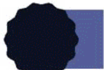
891 * ✓ ② VIOLETA DIOXAZINA VIOLETA DIOXAZINA DIOXAZINE VIOLET VIOLETA DIOXAZINA