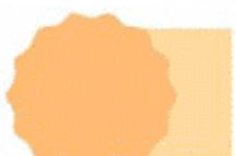
894 ** ✓ ① AMARILLO DE NAPOLES (NIJE) PIGMENTO AMARILLO DE COBRE NAPLES YELLOW HUE PIGMENTO AMARILLO DE COBRE