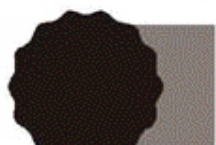
867 * ✓ ① TIERRA SOMBRA NATURAL COBRE DE HIERRO NATURAL RAW UMBER NATURAL IRON OXIDE