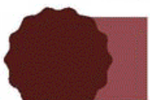
869 * ✓ ① ROJO INDIO COBRE DE HIERRO SINTETICO INDIAN RED SYNTHETIC IRON OXIDE