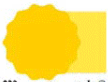
823 * ✓ ③ AMARILLO DE CADMIO AMARILLO DE CADMIO CADMIUM YELLOW CADMIUM SULFIDE