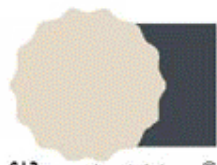
812 * ✓✓✓✓ ② BLANCO IRIDISCENTE COLOUR OF TITANIUM - PEARL IRIDISCENT WHITE TITANUM OXIDE - PEARL