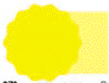
872 ** ✓✓✓✓ ② AMARILLO CLARO AMARILLO DE ANILINA LIGHT YELLOW BRITISH YELLOW