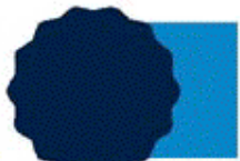
845 * ✓ ① AZUL ULTRAMAR COBRE, CALCIO Y SODIO ULTRAMARINE BLUE COBRE Y SODIO SULFATO