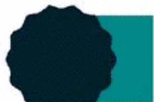
858 * ✓✓ ① VERDE FIALDO FTALOCIANINA CLORURO DE COBRE PHTHALO GREEN COBRE FTALOCIANINA CLORURO