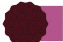
888 * ✓✓✓ ③ VIOLETA QUINACRIDONA VIOLETA QUINACRIDONA QUINACRIDONE VIOLET QUINACRIDONE VIOLET