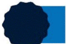
847 * ✓✓ ① AZUL FIALDO FTALOCIANINA DE COBRE PHTHALO BLUE COBRE FTALOCIANINA