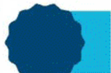
842 * ✓ ④ AZUL CERÚLEO COBALTO DE ESTANIO Y COBALTO CERULEAN BLUE COBALTO ALUMINATO