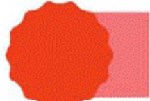
834 * ✓ ③ ROJO DE CADMIO PIGMENTO ROJO DE CADMIO CADMIUM RED CADMIUM SULFOSILOBATE