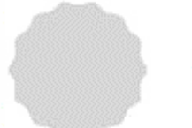
882 ** ✓✓ ① ANARANJADO PERMANENTE PIGMENTO ANARANJADO PERMANENTE PERMANENT ORANGE QUINACRIDONE ORANGE