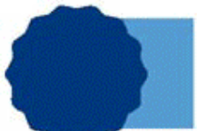
844 * ✓ ③ AZUL DE COBALTO COBALTO DE ALUMINIO Y COBALTO COBALT BLUE COBALTO ALUMINATO