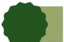
851 * ✓ ③ VERDE DE CADMIO VERDE DE CADMIO Y VERDE DE COBRE CADMIUM GREEN VERDE DE CADMIO Y VERDE DE COBRE