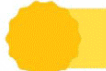
874 ** ✓✓✓✓ ① AMARILLO MEDIANO PIGMENTO AMARILLO MEDIUM YELLOW AZO PIGMENT