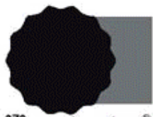
879 * ✓ ② GRIS DE PAYNE COLOUR OF PAYNE'S GRAY PAYNE'S GRAY ULTRAMARINE BLUE - SOFT SLACK