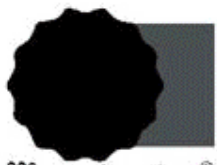
880 * ✓ ① NEGRO MARFIL COLOUR OF IVORY IVORY BLACK BONE SLACK