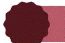
887 ** ✓✓ ② ROJO CARMÍN ROJO TOLUIDINA CARMINE RED TOLUIDINA PIGMENTO ROJO