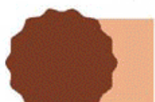
863 * ✓ ① TIERRA DE SIENA NATURAL COBRE DE HIERRO NATURAL RAW SIENNA NATURAL IRON OXIDE