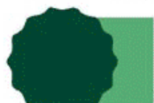
857 * ✓ ③ VERDE FIALDO CLARO FTALOCIANINA CLORURO DE COBRE LIGHT PHTHALO GREEN COBRE FTALOCIANINA CLORURO